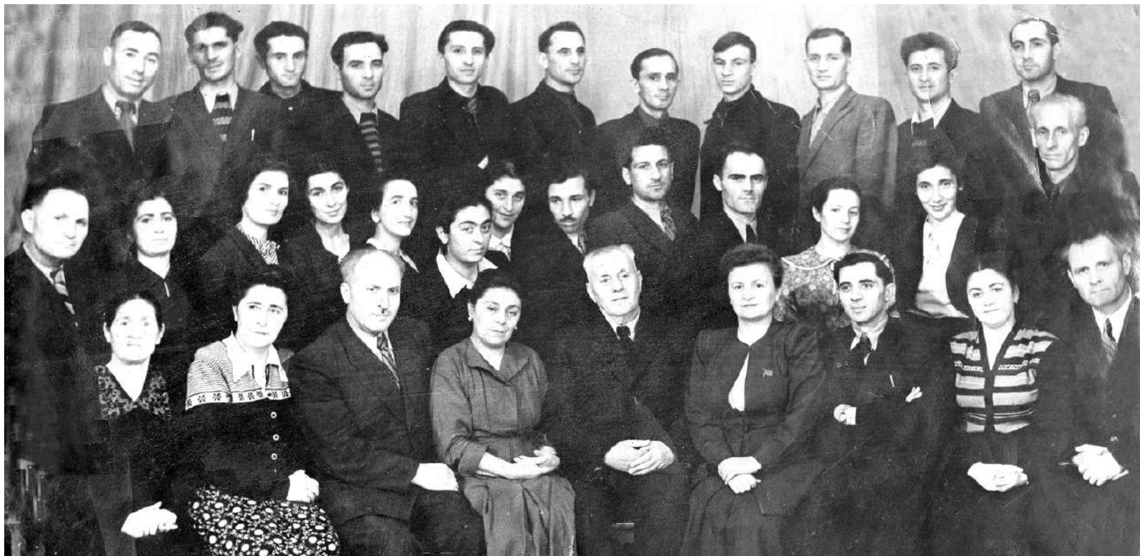
ТОТРАТЫ БЕСÆ ИРОН ТЕАТРЫ АРТИСТТИМÆ (ФЫЦЦАГ РÆНХЪЫ ГАЛИУÆРДЖЫГÆЙ ФÆНДЗÆМ)