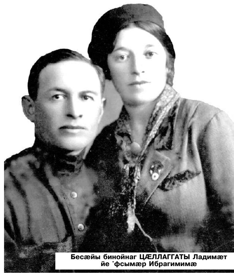
БЕСÆЙЫ БИНОЙНАГ ЦÆЛЛАГГАТЫ ЛАДИМАЕТ ЙЕ 'ФЫСМÆР ИБРАГИМИМÆ

Æз мæхæдæг Ирон театры цур студимæ ахуыр кæнынмæ куы бацыдтæн, — дзырдта нын дарддæр Зирæ, — уæд Бесæ махæмæ, ахуыр-дзау фæсивæдимæ, тынг бæхæлар, узæлыдыс ныл тынг фæлмæн æмæ уæзданæй. Тызмæг, схуыст ныхас дзы никуы фехъуыстон, стæй канд æз нæ, фæлæ ма мæмæ æй ахуыр кодта, уыдон дæр. Мæнæн-иу тынг фæдзæхстæ, Шекспиры уацмыстæ арæх-дæр кæс, зæгъгæ. Кæд уыцы рæстæгæй бирæ азтæ ра-цыд, уæддæр ын йæ фæдзæхстæ æмæ цæст-уарзон ахаст арæх æрхъуыды кæнын ныр дæр.