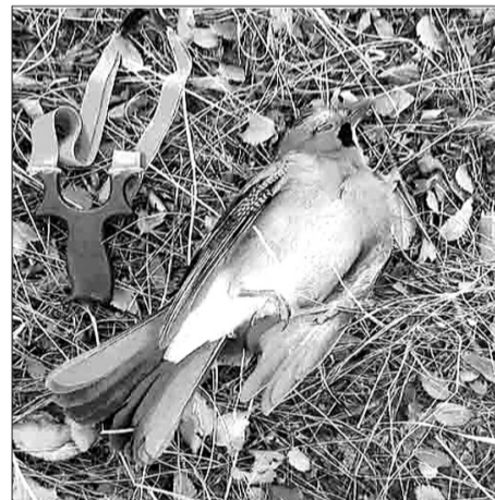
...Цьу дурәй әрхауд, әз әм рәвдз балыгьтән әмә иә мә

Уый у царды цыбыр әмә әгьа-тыр цау. Дәу тыххәй цард иә цал-хы куыст не 'руромдзән. Бахуыды кән уый дәр, әмә дын уыцы цауи-мә Хуыцау баләвәр кәндзән "уә-йдыты тыхтә", әндәр зонд, куыры-хондзинад, дардмәуынынад... Уыцы "ләвәрттә" ранымадән уыдон сть иә чысылдәр хәйттә. Буар сә кә-цәйдәр гуырын кәндзән әмә сыл