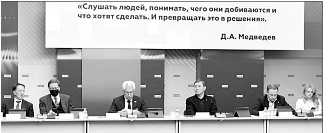
«Слушать людей, понимать, чего они добиваются и что хотят сделать. И превращать это в решения».

"Сæйрагдæр уый у, æмæ адæмон программæ арæзт цыд адæмон сæхицæй æмæ у адæмон,