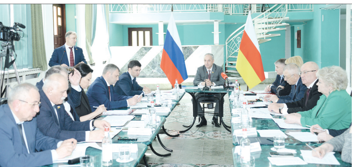
(Кæрон 2 фарсыл)