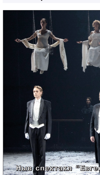
Ныв спектакли "Евгений Онегин" æй