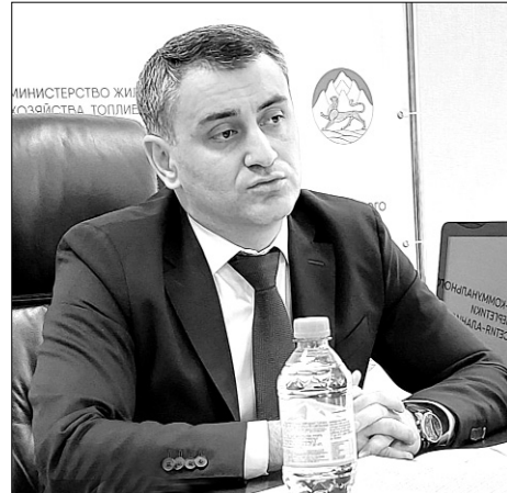
амалгонд донæй пайда кæнынц æнæзаконæй. Майы бæрæгбæтты фæстæ сæ бæрæг кæндзысты, ныр дæгæн та архайд цæуы сæрмагонд кусæнгæртæ самал кæныныл. Цыбыр рæстæгмæ цы куыстуæттæ

Донцирæнтæй ист цæуы 320 мин кубометры дон, уыдонæй æрмæст 70-æн цæуы фыст, иннæ хай ивгъуыйы иувæрсты. Сæйраг ахосаг — техникон æмæ экономикон фарстатæ: дондзæуæнты хыз æдзæллаг уавæры ис, егъау æмæ астæуккаг бизнесы куыстуæттæ