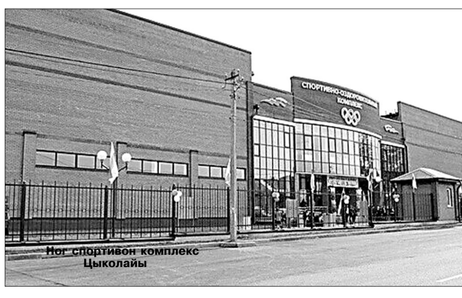
Ног спортивон комплекс Цыколайы