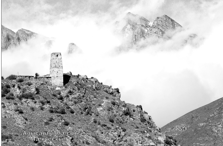
Абысалты мæссыт Мæхческы