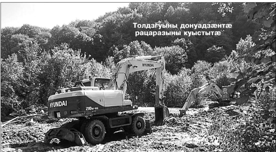
Толдзугуыны донуадзæнтæ рацарæзыны куыстыгæ