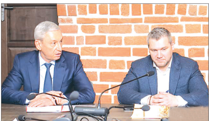
Фарсмæ сты Уæлахицы музейы специалисттæ дæр.

Боны фæткмæ рахастой “Беслæн. 1-æм школа”-ы культурон-патриотон центры экспозицитыл бакусынны фарста. Нырмæ уал бæстхæй рацарæзтой, дарддæр бавналдысты концепцимæ, фæстæдæр — концептуалон проект царды уадзынмæ, дизайн-проект æмæ экспозици аразынмæ. Центры аивадон-архитектурон концепцийыл куыс “Гранта продакшн”, сæ