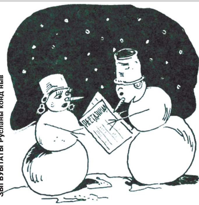
"Рæстдзинад" куы рафыстай, уæдæй фæстæмæ мæ ферох кодтай!