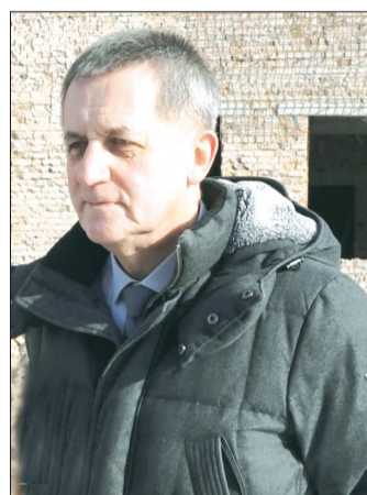
“Бæстхæй дзуапп дæт-

Фыццагдæр фæдта, тагъд æххуысы дæлстанцæйы куыстытæ куыд цæуынц, уый. Раздæры ахæм куыстуаты бæстхæй тынг базæронд, сфæнд æй кодтой фехалын æмæ бавнæлдтой ног дæлстанцæ аразынмæ. Æппæт арæзтадон куыстытæ кæронмæ æрхæццæ сты, Хицауады Сæрдары хæдывæг куыд радзырдта, афтæмæй хъуамæ дæлстанцæ байгом кæной мартыйы.