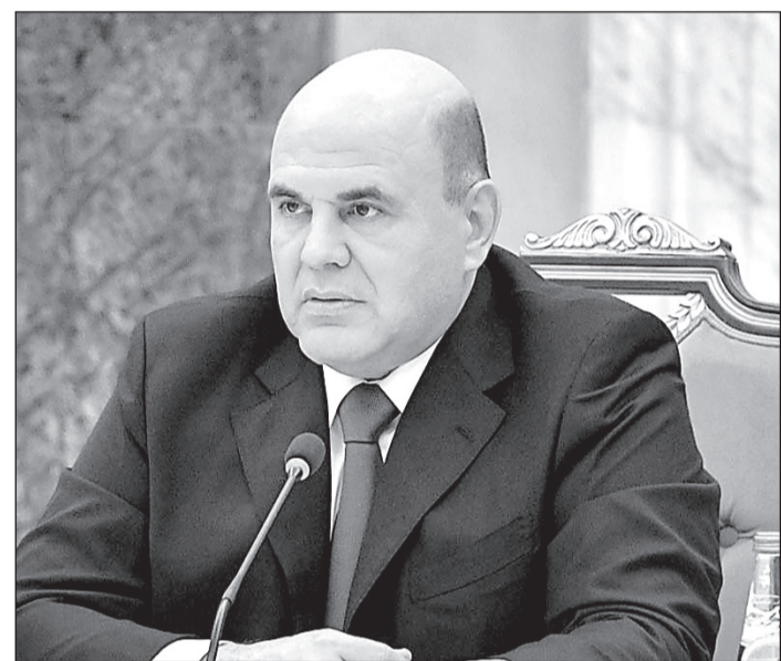
Михаил Мишустин куыд фæбæрæг кодта, афтæмæй ныры стратеги йæ тыхы ис 2019 азæй,

Федералон министрты кабинеты разамонæг, сесси гом кæнгæйæ, куыд радзырдта, афтæмæй нæ бæстæйы Президент Владимир Путин Федералон Æмбырдмæ йæ ныстуаны фæзуатон бастдзинадты, регионты инфраструктурон гæрæнтæ фæныллæгдæр кæныны ахадындынад фæбæрæг кодта. Уымæй дарддæр, сæвæрдта чысыл горæттæм, хъæутæм, историон цæрæн бынæттæм хуызæнæн базиныны æмæ адæмы царды уавæртæ фæхуыздæр кæныны нысантæ. Регионтæ, комкоммæ бæстæйы арæнтыл чи ис, уыдон хуызæн исой æххуысы мадзæлттæ.