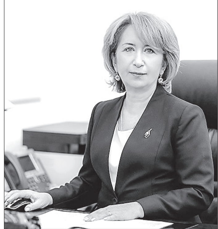
Æвзæрæн хайæдты базардон фæткæн фæдæттæ чи сарæзта, республикæйы муниципалон иугæндты уыцы сæргълæуджытæн, дзыллон хабархæссæг фæрæзты минæвæрттæн, энергетиктæн, бастдзинад аразджытæ æмæ алыхуызон ведомствæты куджытæн бузныг зæгъын. Куысты хæстæ биноныг сæххæстгæнгæ бархонтæй райгонд дæн.

уыд æвзæрæн къамисты алы уæнджы дæсныдзинадæй дæр. Ацы хуыддаг сыхах иттæг арахстджынаы сæххæст кодтат.