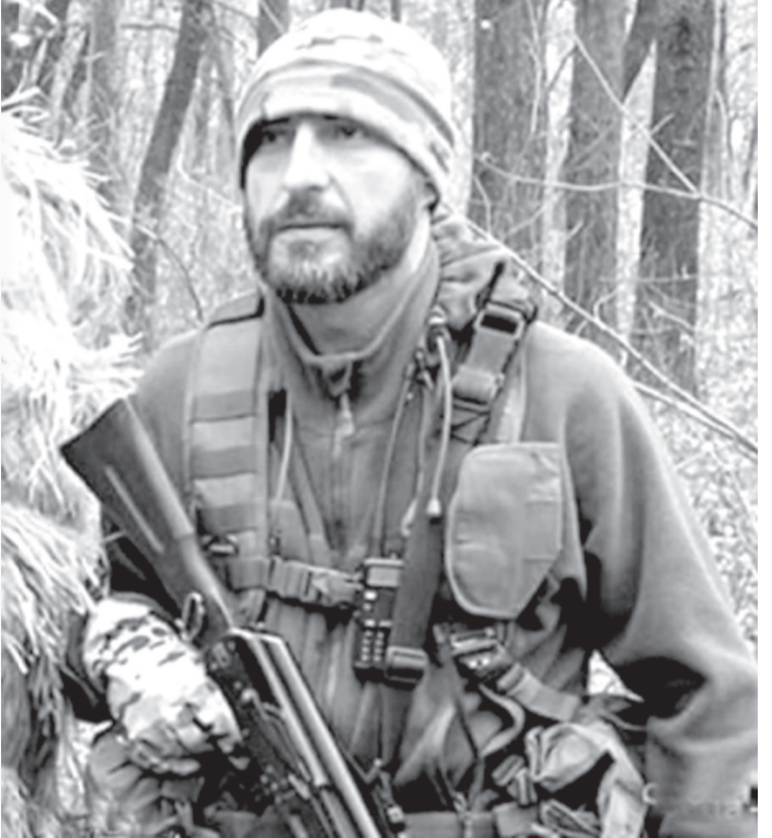
«Ирыстоны Намысан» (йæ мæлæты фæстæ).