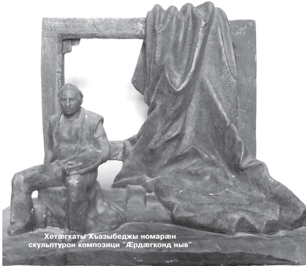
Хетæгкаты Хъазыбеджы номарæн скульптурон композици «'Æрдæгконд ныв»

тон Декабристы клубы, ныр дзы ис театр «Саби». Нæхи цæттæ кодтам Мæскуыйы Аивæдты академиимæ.