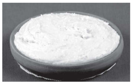
Кæхц хæсджын куыд фæуат, уый уын Хуыцауы цæст бауарæд!

Дзыккакъах – фырты рай-дгъурдмæ бæлгæйæ, ма-дæлтæ куывттой Мадæ зæдмæ, Мадæ-Майрæммæ, фыдæлтæ – Фыры дзуармæ. Сæ кувын хуырыцъарæй уыд æмæ ныр дæр вæййы, фæд-фæдыл чынджытæ кæмæн фæгуыры, уыцы чындзæн, йæ бинонтæн, йæ цæ-гæтæн. Æмæ та йын чызг куы рай-гуыры, уæд ма сæ маст суадзынц ноггъурдæн ахæм арфæйæ: «Дæ къах дзыккайы тыст фæуæд!» Чызджы цæгæтæн та: «Инынæ хатт