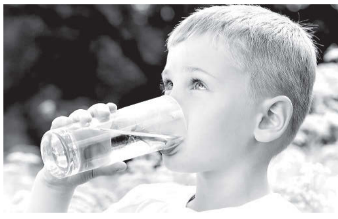
Фæнд: «Абонæй фæстæмæ дон нуазгæ уæд кæстæрæй, цæмæй ахæм бæллæх макæуыл уал æрцæуа!»

Ирон адæммæ хистæр кадджын у, æгъдауы бæр-зонд æвæрд у. Уый фæрсынц зондæй, фæл-тæрддзинадæй, уый ныймайынц, уый æрхъуыды кæнынц фыццагдæр алы хуыддæджы дæр. Æрмæст нæм дон нуазгæ у кæстæрæй. Цæмæн? Уый фæдыл ис ахæм таурæгъ. Кæддæр, дам, дард балцы цæуæг ирон адæмы иу къорд тыгъд быдыры бирæ рæстæг фæцы-дысты. Бафæлладысты, бастадысты, фæлæ фылдæр сфæлмæцыдысты æнæ донæй. Хус быдыры нæ мæсчыты доныл сæмбæлдысты, нæ – судоныл, нæ – цъайыл, æмæ дойнайæ сæ хъару батал, сæ ныфс асаст. Зæ-рондæй-ногæй, стырай-чысылæй дзой-дзойгæнгæ цы-дысты, хылдысты размæ. Кæдæм уыд сæ балц, уый сæ рох дæр фæци, æрмæст ма агурдтой дон нуазынмæ.