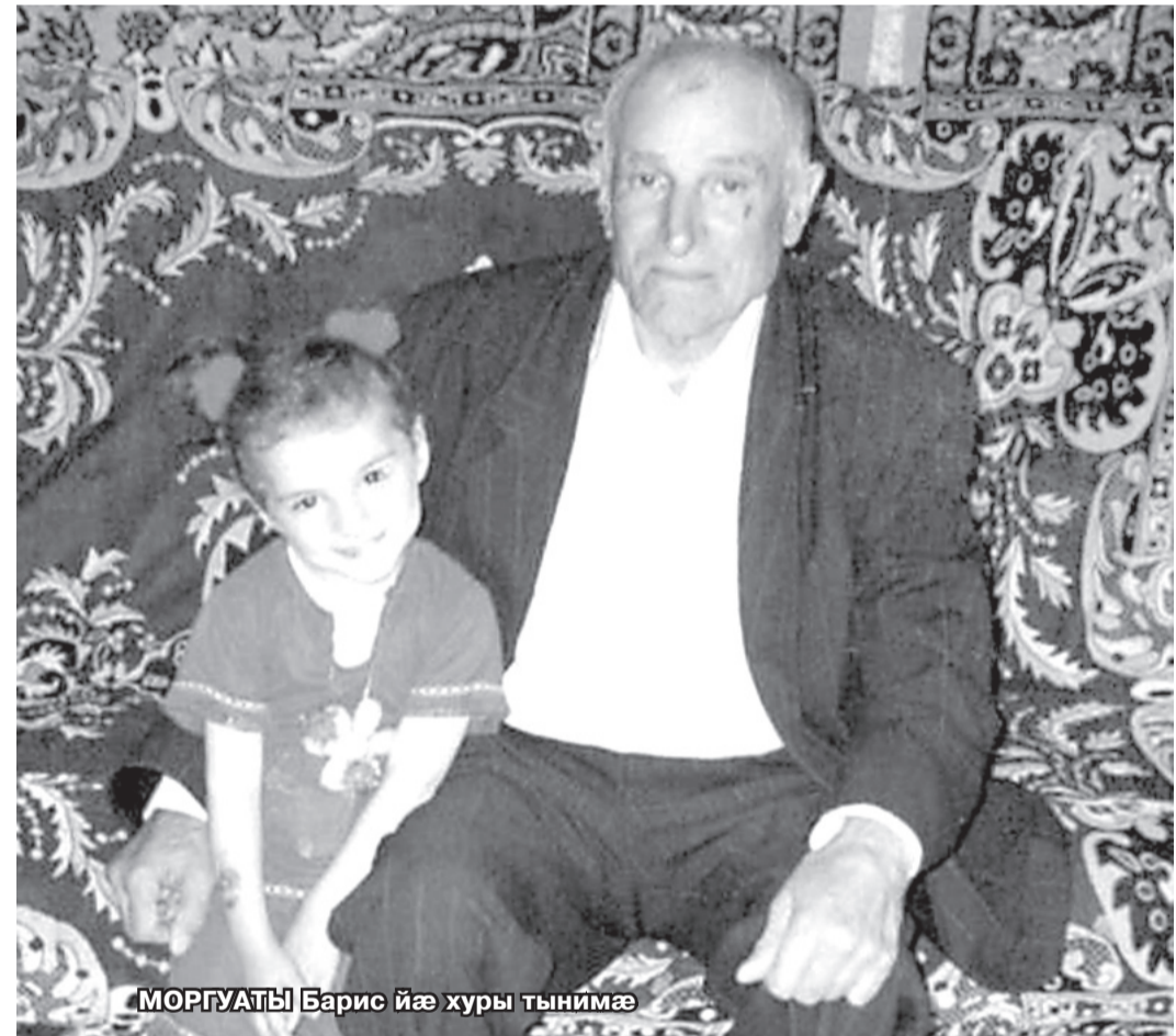
МОРГУАТЫ Барис йæ хуры тынимæ

Алан æмæ Ирæ нырма кæд хæрзæрыгæттæ сты, уæддæр сæ архайдæ у ирон