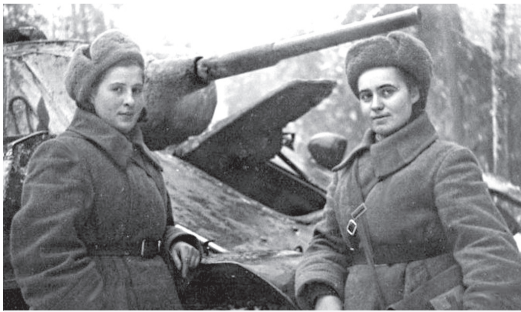
Хæсты азты архивæй ист къам