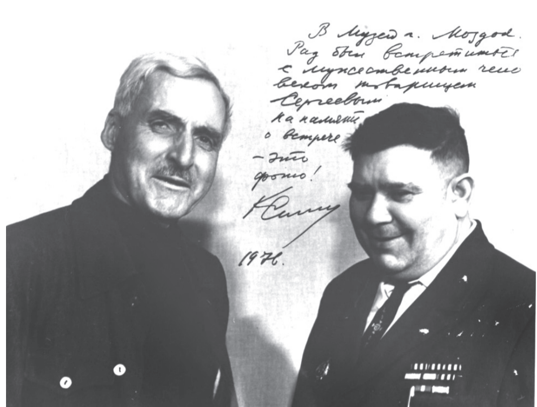
Константин СИМОНОВ ама Илья СЕРГЕЕВ

– Ацы номарæн фæйнæджыты фæрцы æз кад кæнын нæ бæстæ фæ-