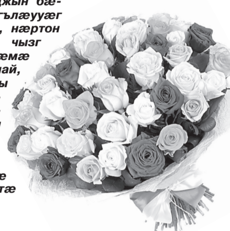
11-æм скъолайы ирон æвзæг æмæ литературæйы ахуыргæнджытæ