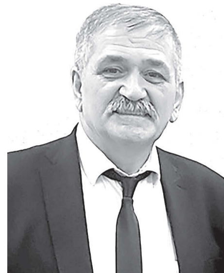
Бетьырбухы падзахадон университеты дунен журналистикэй кафедрэйы профессор, куыста бирэ алыхуызон уэлдэр ахуыр-

Цэагт Ирыстоны падзахадон университеты Ирон филологий амае журналистикэй факультетэн разамынд лэвардта 1999 азэе 2001 азмае. 2001 азы ссис