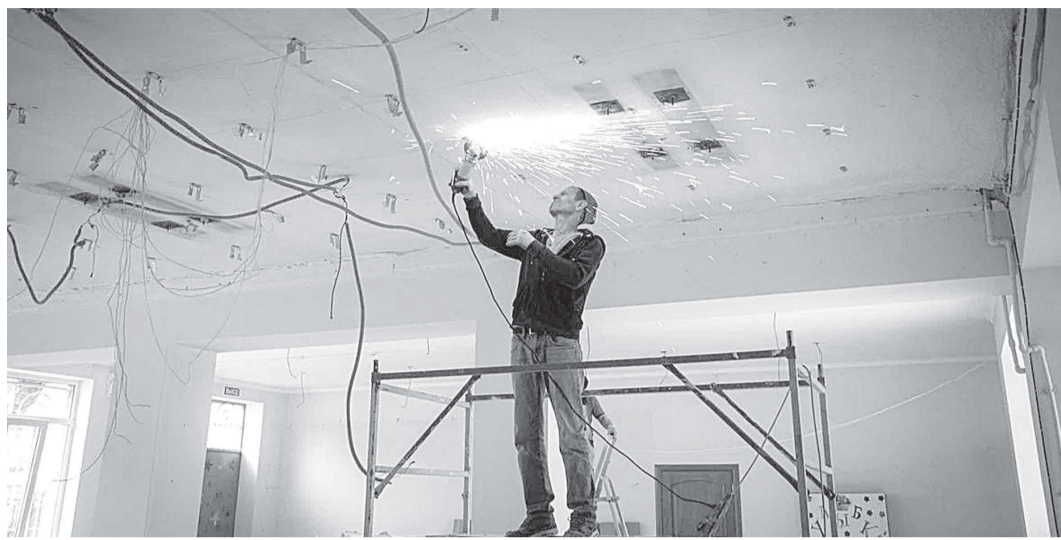
Уæд чыныгдон кусдзæн, куыд «бинонты» библиотекæ – хицон фæзвæрттæ дзы уыдзæн сывæллæттæн, æнахъомтæ æмæ ас адæмæн. 4-æм филиалы (уый та ис

Дзæуджыхъæуы библиотеказы хъæдджы 2-æмæ 4-æм дæлхайæдты бавналдтой бындурон рацарæзты куыстыгæ. Цалцæджы фæстæ дыууæ филиалы дæр кусын райдайдысты нырыккон технологитæй ифтонг библиотекæтæ.