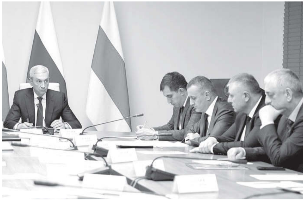
РЦИ-Аланийы Сæргълæууæг æмæ Хицауады пресс-службæ