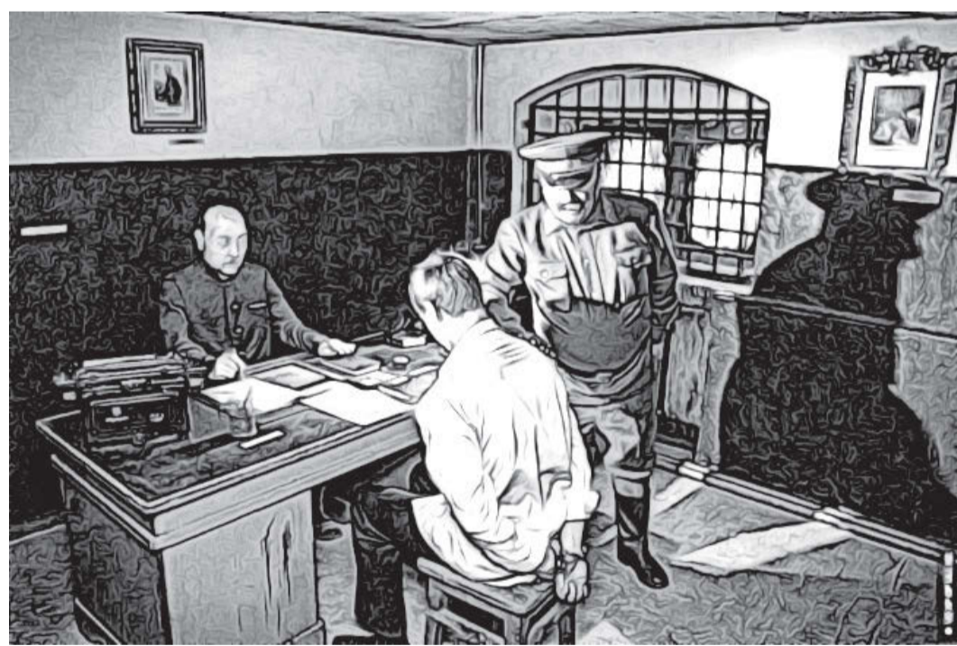
Ертæ æфсымæрæй дæр уыдысты афицæртæ.

Слестгæнджытæ тызмæ-гæй-тызмæгдæр кæнынц, цæвынынц дæр нæ ауæр-дынц. Лæппуйы басæт-тынмæ бирæ нал хæуы, уый бамбæрста булкьон, сыстад йæ бынатæй, тым-