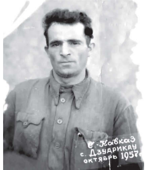
муртæ баззад, уыдон сног кæнынмæ, кустойтой, фæллад ницæмæ даргъæуæ. Бекызæйæн кæд йæ 'нæниздзинад зæрдæхсайгæ уыд, уæддæр иу бон дæр æндæд бадын йæхицæн нæ саккаг кодта. Уый нæ, фæлæ йын, куыд инвалид, афтæ падзахадæй цы фидонтæ æмбæлд исын, уыдонæй дæр никæд ницы райста, афтæ-иу дзырдта, хæсты йæ дарæг кæмæн баззад, уыдон, дам, мæнæй уæззаудæр уавæры сты, æмæ уыдон куы быхсынц, фæлтау сæ уыдонæн раттæнт.

Хæуы нæлгоймагтæ нал баззад, зæрдæтæ, сылгоймагтæ æмæ сывæллæттæ æмхæрутæй бавнæлдтой, адамон хæдзарæдæй ма цы