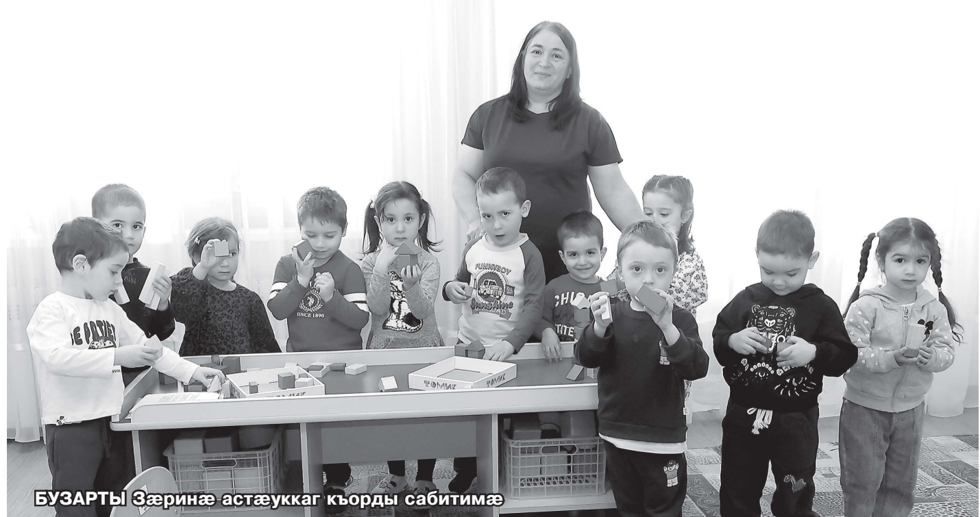
БУЗАРТЫ Зөрөинө астаукаг кьөрдө сөбитимө