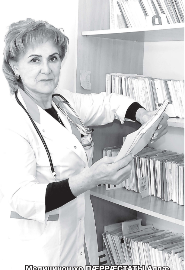
Медицинон хо ПӨРРӨСТАТЫ Аллө

ПӨРРӨСТАТЫ Аллөй Суададжы цөрдэжтө нууылдөр зонынц. Ныр 20 азы куыс медицинон хөйө хөвүи амбулаторий өмө иуэрдөинөй лөгтөд кэны адөмөн.