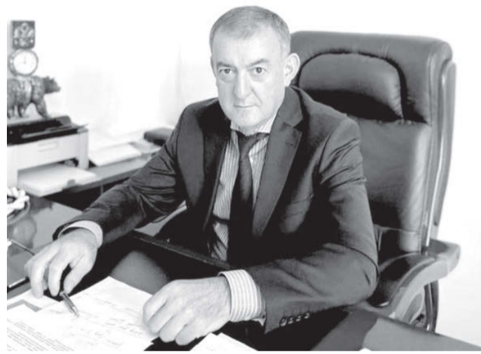
2025 азы балæвæрдтæ Джосланы Сослан фæлладуадзæн базæ «Куссу-парко»-ы проект царды рауадзынæн.

Йæ курдиат паддзахæдон æххуыс, грант райсынмæ