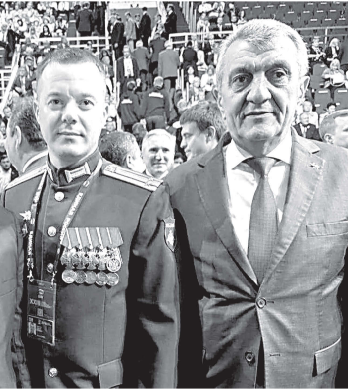
РЦИ-Аланийы Сæргълæууæг æмæ Хицауады пресс-службæ