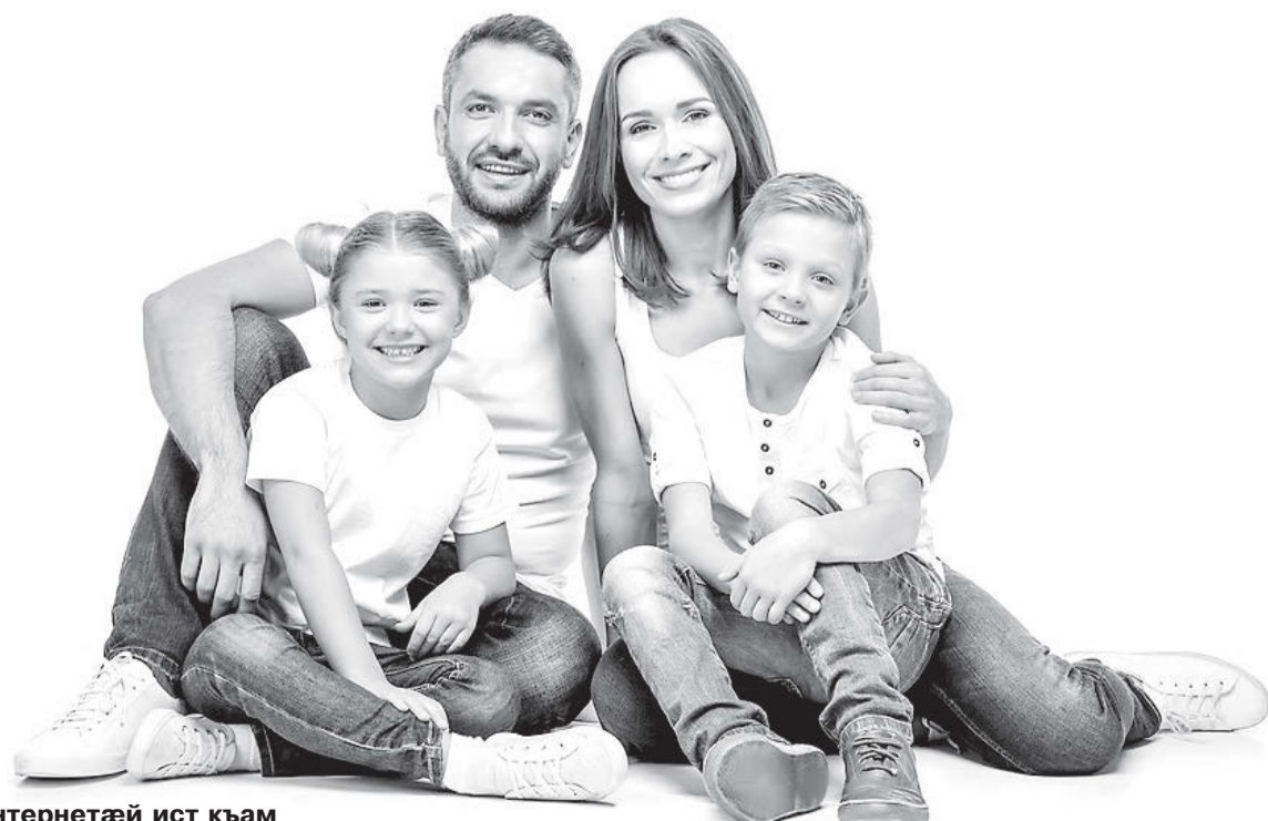
Интернетгай ист кьам

Ныр бирга азты дэргы ныйаргаегай капитал нымад у бинонтан аххуысы хидан хуызыл. Программе архайын куы райдыдта, уадгай фэстгаеме 90 мин цагатырстойнаг бинонтан сты сертификатты хицауттае.