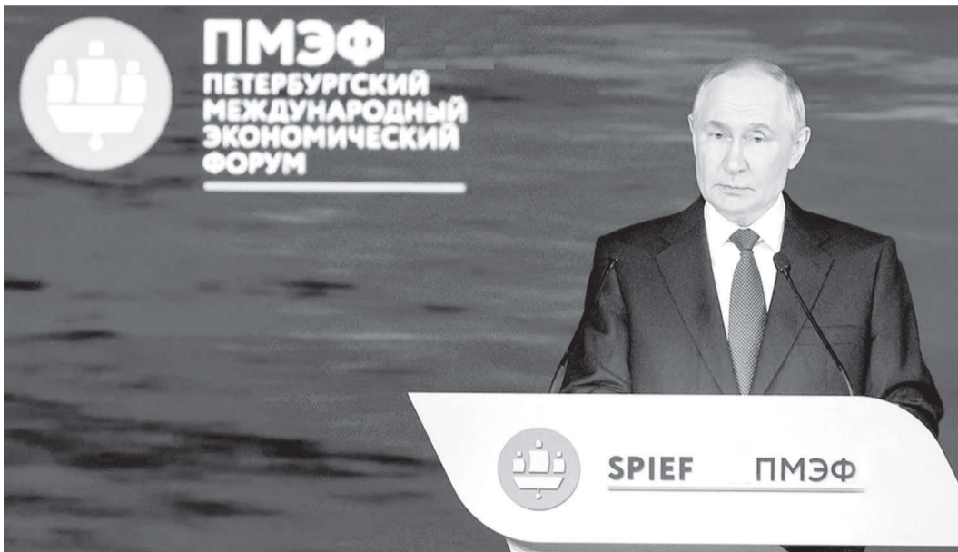
руаджы 'рцъд, ахæм газы хæтæл.

Республикайы Сæргълæууæг зæрдидæг арфæ ракодта «Газпром-межрегионгаз»-ы разамонæг æмæ коллективæн, Цæгат Ирыстоны фæстаг азы цы стыр куыст бакодтой, уый тыххæй. Афтæ, фæстаг фондз азы дæргы регионон æппæт-афнон курорт «Мамысон»-ы онг æвæрд æрчыдысты хызтæ, сарæзтой газы хæтлæг газдæттæн станцæ «Зæрæмæг»-мæ, Алагирæ районы фараст хуамаæ газ уагъд кæй