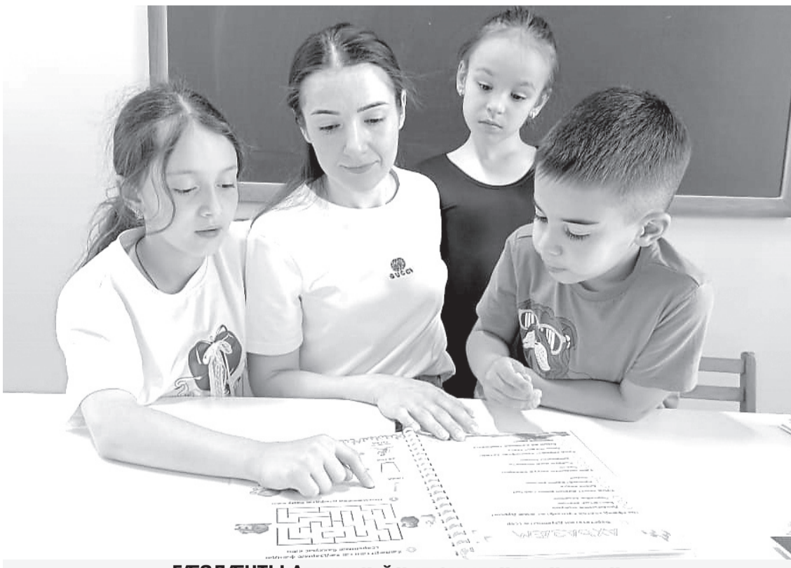
ГÆЗДЭНТЫ Агуындæ йæ хъомылгæнинæгтимæ

Зыдта йæ, сывæллæттæ се 'взаг традицион хуызы зынтæй кæй бамбардзысты, æмæ æрхуыды кодта æндæр мадзал. Уый та у хъазты, зарджыты, интерактивон видеоæрмæджыты хуызы сын ирон дзырдтæ, ныхас амонны. Кæд æм ныв кæнынны курдиат нæй, уæддæр-иу цыдæртæ аныв кодта, æмæ сын