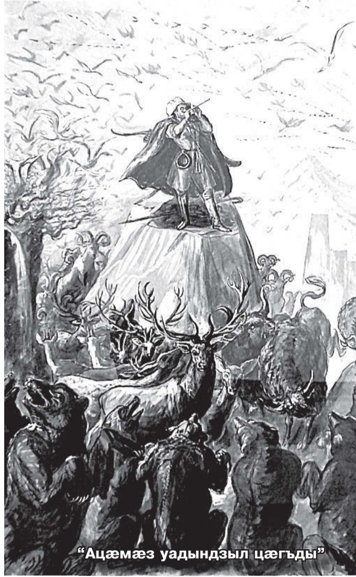
«Ацәмәз уадындыл цәгъды»

Уый уыд афтә. Ленин-град нывдәсныи ады академиямә мәхи цәттә-гәнгәйә, сфәнд кодтон «Нарты куыд»-ы эскиз раттын. Сныв кодтон куыды бадәг бирә ирәтты цуххьаты мидәг хьаматимә, уыдоны 'хәннә та астауәй фынгыл ка-фыдысты Нарты хьайар-тә. Мә куыст куы раттон академияи инспектор Беляковичмә, уәд мәм уый аәнәуәнк каст аербакод-та ама мәм ратта ахәм фарста: «Емә уый та цию? Җрра фесты аыи цы, фынджы уәлә цы кафынц?» Нывкәнынады академияи инспектор Белякович ныхәстә мә ахәм са-гьасы бацәуын кодтой, ама загътон мәхицән, Нарты сныв кәнын аң-дон хуыддаг нәу, ама иын ныцы хатын, адәмон сфәлдыстад нывдәсны-и ады аивады куыд равди-сын хәуы, уый, зәгъгә. Сфәнд кодтон, Нартыл мауал кусын, цалынмә уычы дәнсныи адыл нә сахуыр уыдан стыр ныв-гәнджыты амындай, уәд-мә. Нарты равдисынән мын фәндаг бацәмыдтой, уәлдәр кәй кой ракод-тон, уычы нывгәнджытә: Васнецовы, Билибины, Врубелы, Поленов ама Рерихы конд нывтә. Мәхи цәстәй фәдтон, уыдон