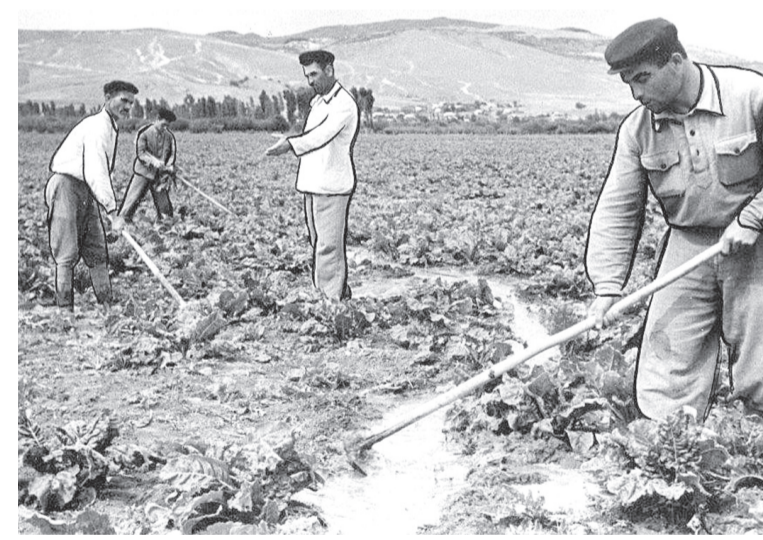
«Фосы дзүг хәкты» ДЗАНАЙТЫ Асанбәджы конд ныв

дәнтә, йәе цармәй та хуыдтой кхәссәтә әмәе дзәкәуылтә, әрәзтой дзы лалымтә. 'Әхсыр, дзидза әмәе царм