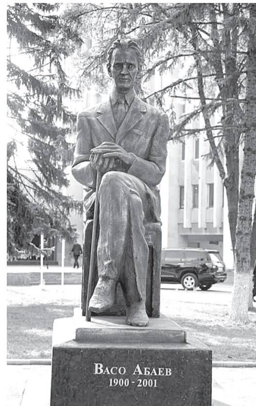
ВАСО АБАЕВ 1900-2001

2001 азы азы 18 мартыйы амард Абайты Васо – сәсдзәм әнусы апа-пәты номдзыддәр, әпшәты фәри-джындәр ирон ләг, генион ахуыр-гонд, аланты байзәддәтәгн Къостайы фәстә тәккә стырдәр хәрзты чи ба-щыд, уыцы Васо...